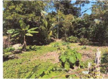
Foto 4: se observa el paso de las aguas residuales del establecimiento