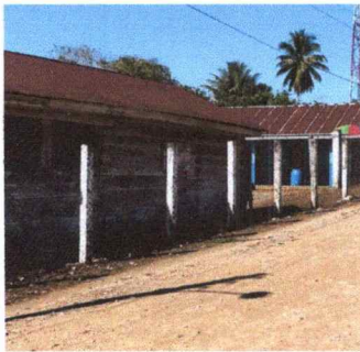
Foto 3: se observa el hundimiento de la tierra del muro perimetral en mal estado